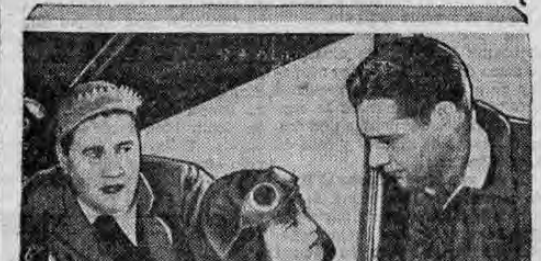
Three sky devils, Jack Oakie, little Robert Coogan and Richard Arlen, in Paramount's airy romance, "Sky Bride"

Para esta semana, el gran teatro Raventós ha preparado su máximo estreno para llevarlo a la pantalla de la función del domingo. Se trata de la grandiosa obra dramática La Novia del Azul, bellísima película interpretada por Jack Oakie, el cómico inimitable y Richard Arlen, el galán impecable de las grandes éxitos, Richard Arlen consigue en esta película uno de sus más sonoros triunfos del cine al interpretar el papel de un aviador que mata a su amigo. Nunca el drama llegó a tener más duros perfiles ni nunca la amistad de tres hombres se complicó más de dolor que en esta película que se impone desde las primeras escenas, obra maestra de la cinematografía en la cual se asiste a imponentes actos de acrobacia aérea que nunca se han visto ni soñado. Un recio problema de hombres, una amarga película de la vida es La Novia del Azul, bellísima superproducción Paramount que estrena el domingo el Gran Teatro RAVENTOS.