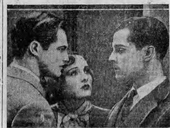
KANE RICHMOND, MADGE EVANS and RAMON NOVARRO in "HUDDLE"

Las mejores números de la "Marimba Jazz Band Atlacatl" y estreno de la última creación de Ramón Novarro "Juventud Triunfante" en el América y el Adela estreno también de JUVENTUD TRIUNFANTE.