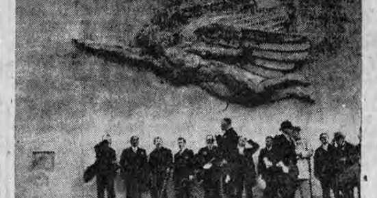
La fotografía muestra el acto de inauguración del monumento erigido en honor de Dieudonné St. Valery-en-Caux, en donde sus aviadores se ve al ministro de la guerra, Painlevé

AHORORA SE ELABORARA EL DE LA SRIA. AL QUE TAMBIEN SE INTRODUCIRAN ECONOMIAS